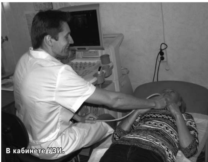
В кабинете УЗИ.

Уважаемые посетители приемной Президента Российской Федерации в Новгородской области!